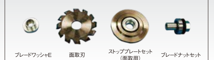
ブレードワッシャーE