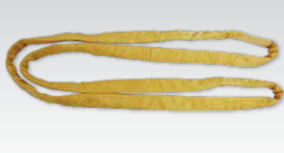
①GX形300~450用ラウンドスリングL=1700