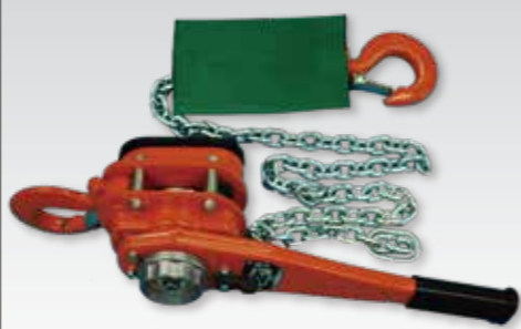
②GX形300~450用チェーンレバーホイスト2トン