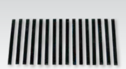
⑭中口径異形管用解体矢