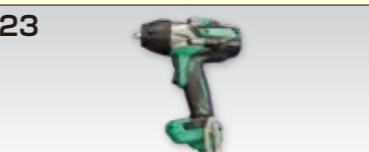
インパクトレンチ WR16SE