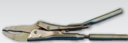
⑩NS・GXロックリング絞り器