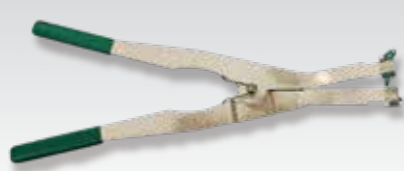
⑨GX形300~450用ロックリング拡大器 (異形管接合用)