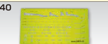
GX形用テンプレート