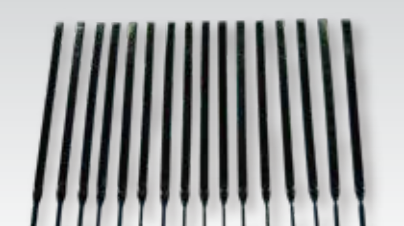
⑬中口径直管用解体矢