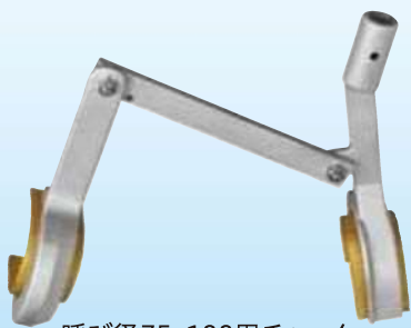
呼び径75・100用チャック