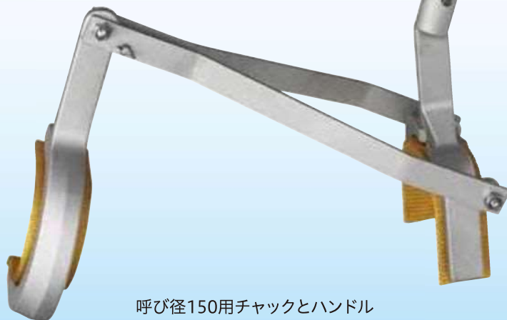
呼び径150用チャックとハンドル